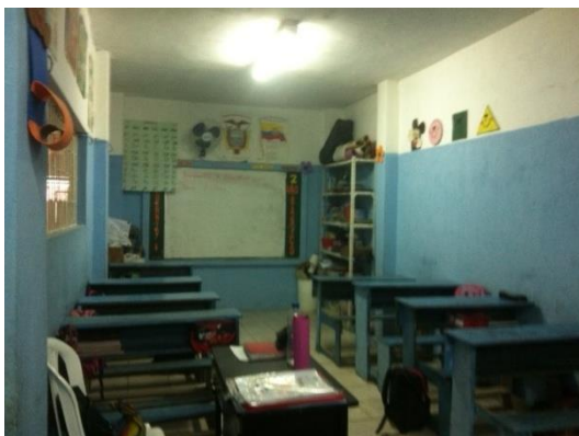
Ook de lokalen, en de schoolbanken zijn allen opnieuw geschilderd en opgeknapt.

Natuurlijk hebben we de eerste maanden van het schooljaar al weer de nodige activiteiten georganiseerd. Zoals ik al in eerdere edities schreef is overal in de wereld de moeder heel